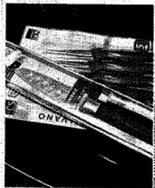
W tym tygodniu można wygrać zestaw noży